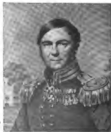
K. F. von Graefe.

Aegyptologe , hat die Lehre von der Accommodation des Auges gefördert und andere wertvolle Beiträge zur Physiologie des Auges geliefert. In der praktischen Medizin ist vor allem zu gedenken des Vaters der sogen. «physiol. Medizin»